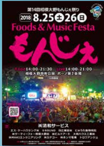
※駅掲載用ポスター例 (過去のサンプルです)